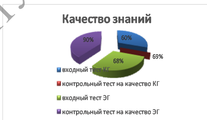
Рисунок – Качество знаний студентов

Результаты анализа свидетельствуют, что не все студенты умеют самостоятельно работать с аудитивным текстом, составлять план