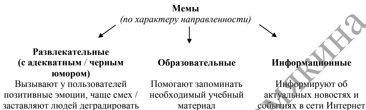
Схема 1. – Виды Интернет-мемов

Основными характеристиками Интернет-мема являются: информационная наполненность, связь с определенной аудиторией, для которой он служит способом выражения эмоций, способность к быстрому распространению от человека к человеку [3, с. 415].