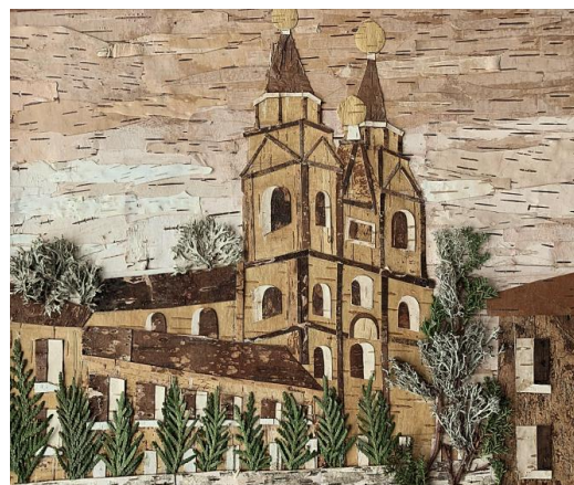
Б) «Кафедральный собор святого Архангела Михаила»